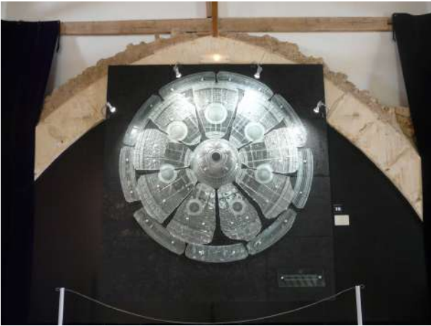
Exposition Temporaire 2015-2016 : « Légendes »

La visite de l'exposition temporaire permet aux élèves de découvrir les techniques contemporaines du vitrail et les univers artistiques des artistes verriers d'aujourd'hui.