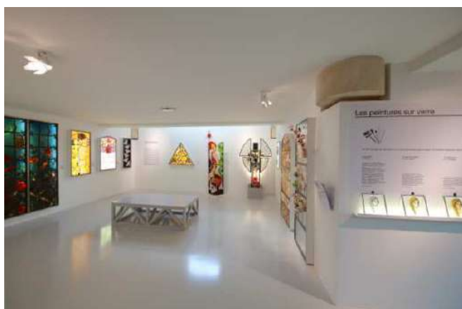
Parcours permanent, Salle Art Nouveau & Vitrail contemporain