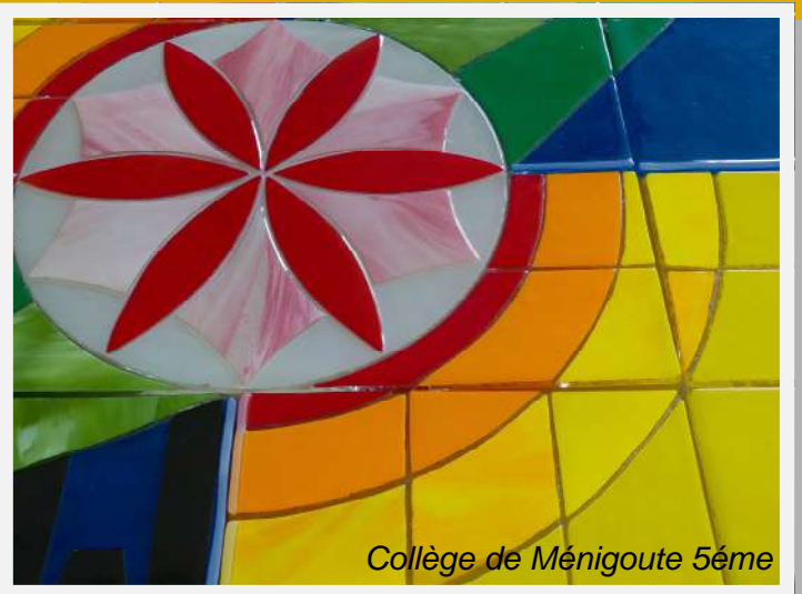
Collège de Ménigoute 5ème