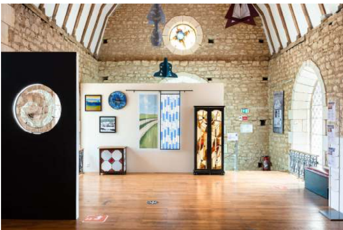
Exposition Temporaire 2020 et 2021 : « Trompe -l'œil »