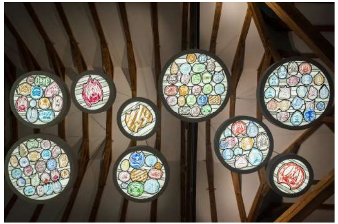
Exposition Temporaire 2019 : « Vitropolis »