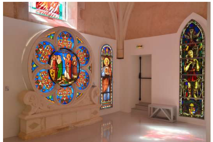
Parcours permanent Salle 19 e siècle