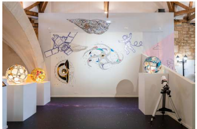
Exposition Temporaire 2022 : « En Verre Elles »