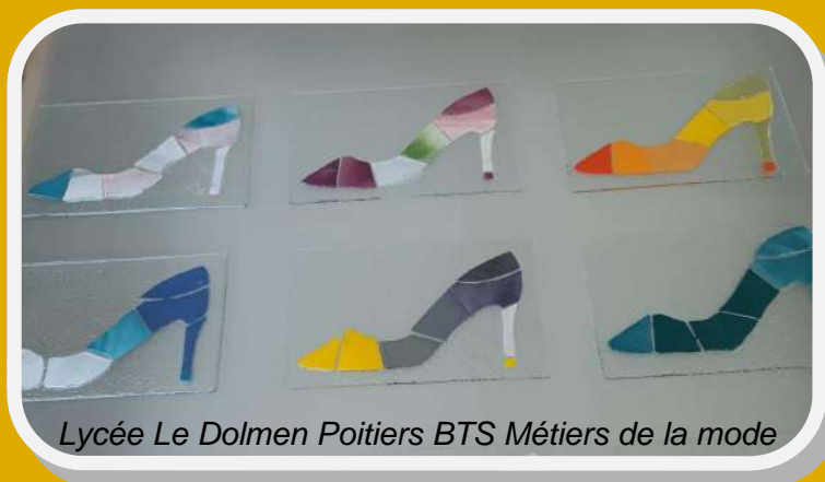
Lycée Le Dolmen Poitiers BTS Métiers de la mode